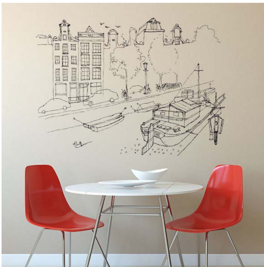
Samolepka Amsterdam od Chispum, Bonami

To, že je interiér zařízen nadčasově, nemusí nutně znamenat, že není „trendy“. Je dobré, aby byl nadčasový základ interiéru, to znamená bezvadná dispozice, kvalitní podlaha, vhodně zvolený nábytek, který nezastavuje prostor. Pokud někdo rád podléhá módnímu diktátu, tak stačí například jednu stěnu interiéru vymalovat barvou, která byla vyhlášena jako „barva roku“, nebo si může pořídit trendy doplňky z Bonami – polštáře , grafiku na stěny , tapetu či zajímavý nábytkový solitér . Prostě něco, co může člověk lehce změnit, až se zase trend změní a on bude chtít být stále „in“.