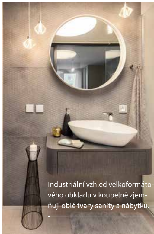
Industriální vzhled velkoformátového obkladu v koupelně zjemňují oblé tvary sanity a nábytku.