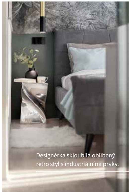
Designérka skloubila oblíbený retro styl s industriálními prvky.