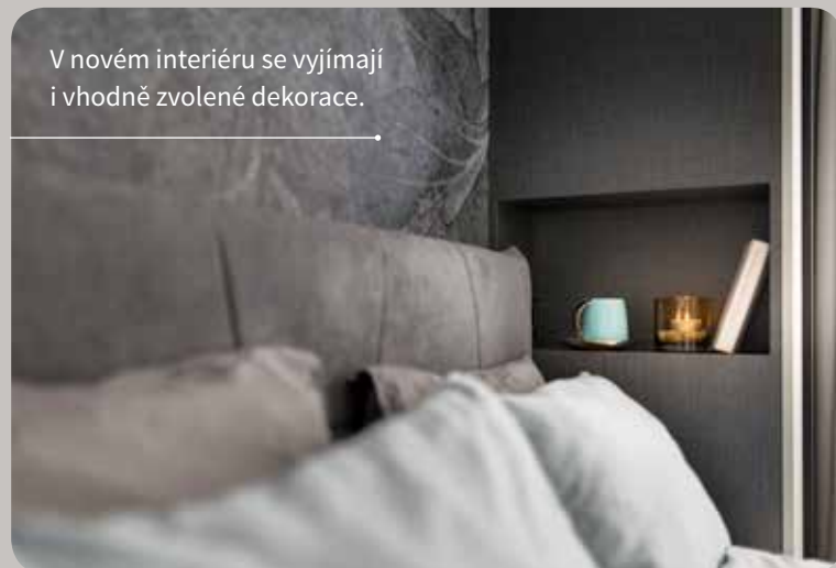
V novém interiéru se vyjímají i vhodně zvolené dekorace.