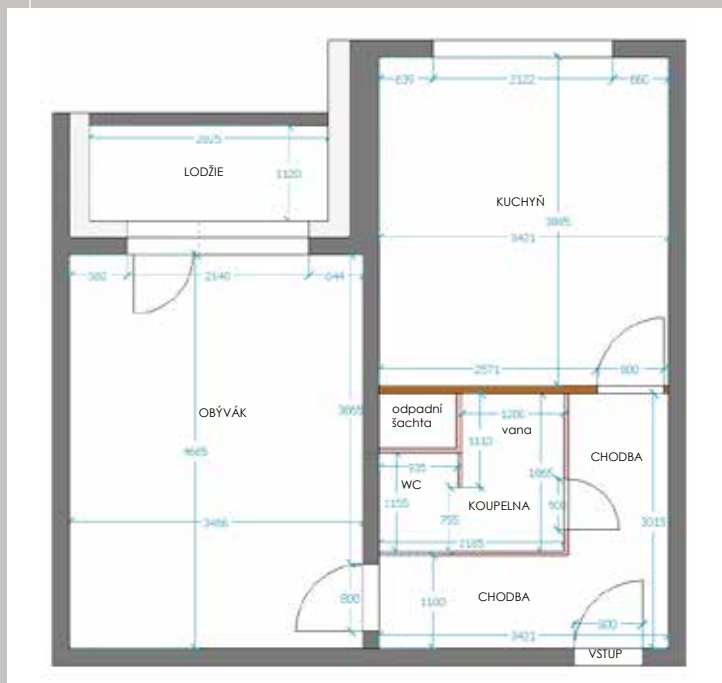
Původní půdorys panelákového bytu 1+1(40 m 2 )